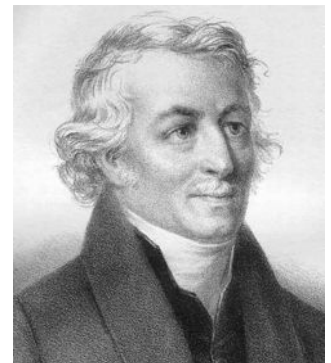
Frédéric-César de La Harpe war aus Sicht der Konservativen der Totengräber - aus Sicht der Liberalen aber der Retter der Eidgenossenschaft. Im Waadtland geboren, studierte er dann in Deutschland und wurde Erzieher in der Zarenfamilie. Dann wurde er Führer der schweizerischen Revolutionärspartei, der sog. Patrioten. Er ermunterte das französische Direktorium zur Intervention in der Schweiz. Als Mitglied des schweizerischen Direktoriums versuchte er - nach dem Vorbild Napoleons - diktatorische Macht an sich zu reißen, was misslang. Er floh dann nach Paris.

In Oberitalien hatte eine solche „ Volksbefreiung “ bereits begonnen. Napoleon Bonaparte hatte seiner Zisalpinischen Republik auch das Veltlin, Bormio und Chiavenna einverleibt (bisher waren das Untertanengebiete Graubündens). Die Bevölkerung dort hatte das gewünscht.