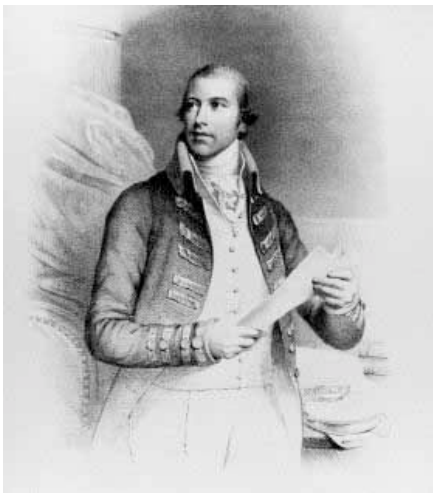
Der britische Botschafter William Wickham, ein James Bond der Revolutionskriege. Französische Agenten berichteten über sein Spionagenetz nach Paris, worauf die Schweiz ihn auf Druck Bonapartes auswies.

Unter Glockengeläute und Kanonendonner, von Kavallerie und Fussvolk begleitet und von einer unüberschaubaren Menschenmenge gefolgt, zogen die Tagsatzungsherren vom Rathaus zur Schwurstätte unter freiem Himmel und bestiegen die fahnenbehängene Tribüne. Der Zürcher Bürgermeister hielt eine eindringliche Rede: