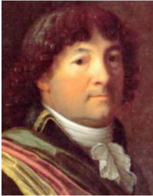
Peter Ochs , 1752 im franz. Nantes geboren, Oberzunftmeister der Stadt Basel, schrieb eine liberale Verfassung für die Schweiz, von den Konservativen als „höllisches Ochsenbüchlein“ beschimpft. Auf Druck der Franzosen kam Ochs dann in die helvetische Regierung.

Das tönte zwar gut, war aber doch ein Aufruf zur Revolte . Würden die Franzosen bloss um der Freiheit willen den Unterdrückten in der Schweiz zu Hilfe kommen? Viele Schweizerinnen und