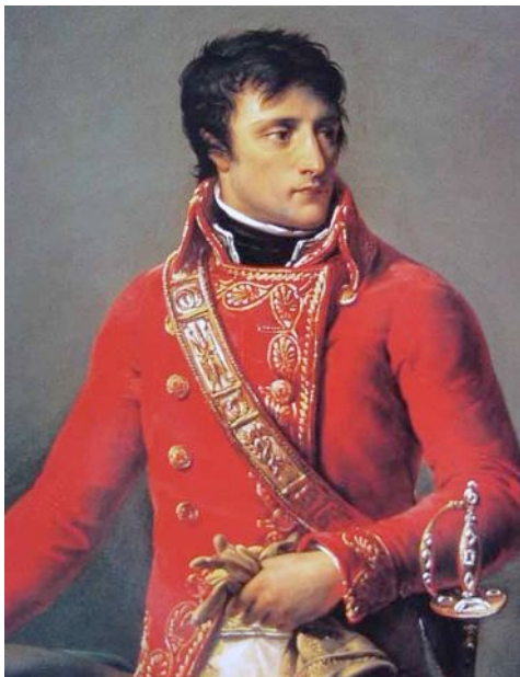
Napoléon Bonaparte als Erster Konsul Frankreichs. Er wurde 1769 als Napoleone Buonaparte auf Korsika geboren. Militärschule bei Paris, dann Jakobiner. Bei der Niederschlagung eines Royalistenaufstands fiel er durch besondere Rücksichtslosigkeit auf. Mit 24 Jahren zum Brigadegeneral befördert wurde er zum einflussreichsten und im Volk beliebtesten Revolutionsgeneral. 1799 machte er sich durch einen Staatsstreich zum Ersten Konsul, 1804 zum Kaiser der Franzosen.

Die Landbevölkerung des Baselbiets verlangte 1797 Freiheit und Gleichheit und wurde dabei von liberalen Politikern aus der Stadt wie Peter Ochs und Peter Vischer unterstützt. Der Rat zögerte zunächst. Nun drohten die Revolutionäre offen mit einer französischen Intervention, steckten die Schlösser der Basler Landvögte, die Waldenburg, die Farnsburg und die Homburg in Brand und zogen bewaffnet gegen Basel. Endlich war der Rat bereit, die berechtigten Forderungen der Landbevölkerung ohne Blutvergiessen zu erfüllen. Man führte eine Vereinigungsfeier durch. Die Patrioten, wie sich die liberalen Politiker damals nannten, organisierten die Wahl einer verfassungsgebenden „Nationalversammlung“. Peter Ochs reiste nach Paris, um dort an einer Helvetischen Verfassung für die ganze Schweiz zu arbeiten. (Zur