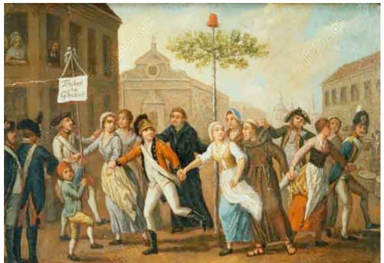
Das Volk tanzt um einen Freiheitsbaum

„Ich fürchte, sie werfen mit einer ganz unbeträchtlichen Macht noch gar alles zu Boden, unsre Freyheit, Religion. Sicherheit des Eigentums und des Lebens. Sie werden den Krieg einen Krieg gegen die Reichen und Aristokraten nennen und das arme Volk damit verführen. Die allerniederträchtigsten Mittel erlaubt sich Mengaud dazu... Alles rückt gegen Bern an. Von Lausanne fordern sie, noch ehe sie da sind, 700 000 £. Denn das Heer hat kein Geld, keine Schuhe, Kleider und Strümpfe...“