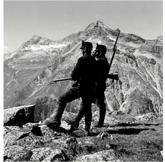
Beobachtungsposten an der Grenze

Die Schweiz ist vom Krieg umbrandet, bleibt aber wie durch ein Wunder eine Friedensinsel. Trotzdem gibt es in dieser schlimmen Zeit auch Probleme für das kleine Land: Langer und langweiliger Militärdienst mit Drill und Schikanen, Verteuerung und Rationierung der Lebensmittel, Verteuerung der Mieten, knappe Brennstoffe, Graben zwischen Deutschschweizern und Romands, Angst, auch in das mörderische Ringen einbezogen zu werden, soziale Unruhen mit Streiks und Strassenschlachten.