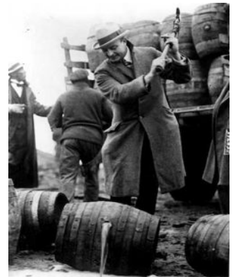
Unter Aufsicht von Beamten müssen die Händler den Alkohol vernichten.

Als 1920 in den USA das Prohibitionsgesetz, das totale Alkoholverbot, in Kraft trat, eröffnete sich dem organisierten Verbrechen ein äußerst einträgliches Betätigungsfeld: illegale Herstellung und Schmuggel von Alkohol.