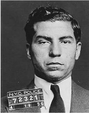
Der legendäre Charles „Lucky“ Luciano (1897-1962) war Padrone der Cosa Nostra in New York.

Die Mafia entsteht im Sizilien des 18. Jahrhunderts als Selbstschutzorganisation gegen Obrigkeitwillkür. Mit der Zeit entsteht aus dem Geheimbund eine regelrechte Subkultur. Zunächst zeichnen sich die Mitglieder dieser „Ehrenwerten Gesellschaft“, wie sie sich selber nennen, durch ein bestimmtes Sozialverhalten aus. „Omertà“ (Schweigen) und „Vendetta“ (Rache) bestimmen das Zusammenleben in der Mafia und das Auftreten gegen außen. Die Mafia-„Familien“ nutzen ihre sich entfaltende Macht zur illegalen Bereicherung.