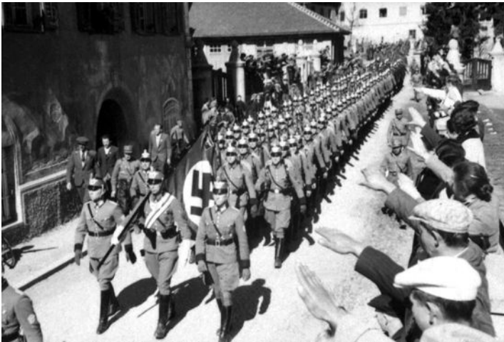
12. März 1938: Eine deutsche Polizeieinheit marschiert in Österreich ein.

Kaum ist Hitler an der Macht, streift er die Fesseln des verhassten Friedensvertrags von Versailles ab. 1933 verlässt Deutschland den Völkerbund. Gleichzeitig beginnt Hitler, die Wehrmacht aufzurüsten, die bald wieder den andern europäischen Armeen ebenbürtig ist. 1935 kehrt das Saarland durch eine Volksabstimmung zu Deutschland zurück. Im Jahr darauf marschiert die Wehrmacht in das demilitarisierte Rheinland ein. Die Westmächte Frankreich und England begnügen sich mit leeren Protesten.