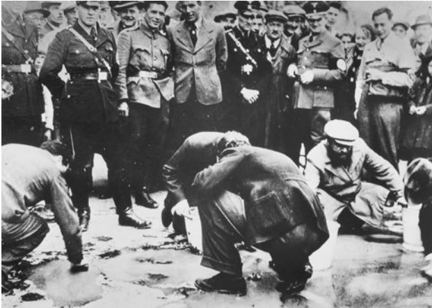
Jüdische Wiener werden gezwungen, die Straßen für den Besuch Hitlers zu reinigen, März 1938.

Hitler nötigte Schuschnigg, Nationalsozialisten in die österreichische Regierung aufzunehmen . Schuschnigg kündigte für den 13. März eine Volksabstimmung an, um zu klären, ob die Österreicher Deutsche werden wollen. Das passte Hitler zum jetzigen Zeitpunkt gar nicht. Am 11. März hielt Schuschnigg eine Radio-Ansprache an die Bevölkerung und verabschiedete sich mit den Worten: „ Gott schütze Österreich “.