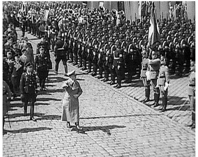
Hitler in Wien am 14. März 1938

Bei der anschließenden Volksbefragung erklärten sich 99,73 Prozent für die „Wiedervereinigung“ mit dem Deutschen Reich.