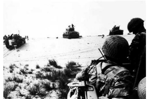
Israelischer Vormarsch Richtung Suezkanal im Juni 1967

Unter Ausnutzung des Überraschungsmoments beginnt Israel am 5. Juni 1967 an drei Fronten (Syrien, Jordanien und Ägypten) einen Präventivkrieg gegen seine arabischen Nachbarn. Alle Bemühungen um eine Entschärfung des israelisch-arabischen Konflikts sind gescheitert. Nach sechs Tagen geht der Krieg zu Ende, und zwar mit erheblichen Geländegewinnen der Israelis. Sie haben nun die Kontrolle über den Gaza-Streifen (von Ägypten), das Westjordanland (von Jordanien) und die Golan-Höhen (von Syrien). Außerdem erobert Israel Ost-Jerusalem. Damit haben die Juden wieder Zugang zu einer ihrer wichtigsten religiösen Stätten: der Klagemauer. Insgesamt besetzt Israel ein Gebiet von der dreifachen Größe des eigenen Landes. Der Sinai wird 1982 zurückgegeben.