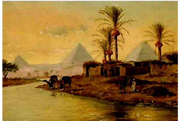
„Am Nil“ - Gemälde aus dem 19. Jh.

Es ist die Zeit, da die Menschen nördlich der Alpen in einfachen Holzhütten wohnen und gerade lernen, den Acker zu bestellen. Da lebt im Niltal bereits das Volk der Ägypter in einem geordneten Staat. Ihre Äcker bringen reiche Ernten, für eventuelle Missernten legen sie Vorräte an. Wissenschaft und Baukunst stehen in Blüte. Es gibt schon Städte mit Tausenden von Einwohnern. Das Land wird vom Pharao regiert. Die Pyramiden, die Grabstätten der Pharaonen, gehören zu den 7 Weltwundern der Antike.