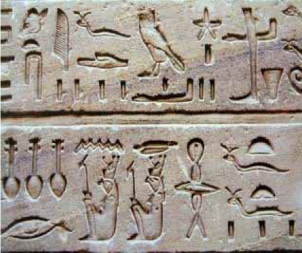
Ägyptische Hieroglyphen

Weil der Nilschlamm in jedem Jahr die Ackergrößen verdeckte, mussten die Grenzsteine häufig ausgebuddelt / die Äcker immer wieder neu vermessen werden. Dies förderte nicht nur das soziale Verhalten der Menschen in Ägypten, sondern machte sie auch aggressiv / zu Mathematikern und Naturforschern . Die Menschen in Ägypten lernten sehr früh, Flächen (Dreieck, Rechteck) zu berechnen.