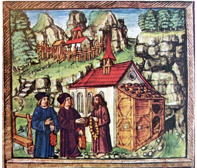
Niklaus von Flüe wird gebeten, im Streit der Ratsherren zu Stans zu vermitteln. (Zeitgenössische Darstellung aus der Chronik Schilling)

Die Städte verlangen ferner, dass an Stelle der vielen Bundesbriefe ein „gemeiner, gelicher und zimlicher Bund“ trete - in heutiger Sprache: Die Städte tendierten Richtung Bundesstaat (Union) während die Landorte den lockeren Staatenbund (Föderation) beibehalten wollten.