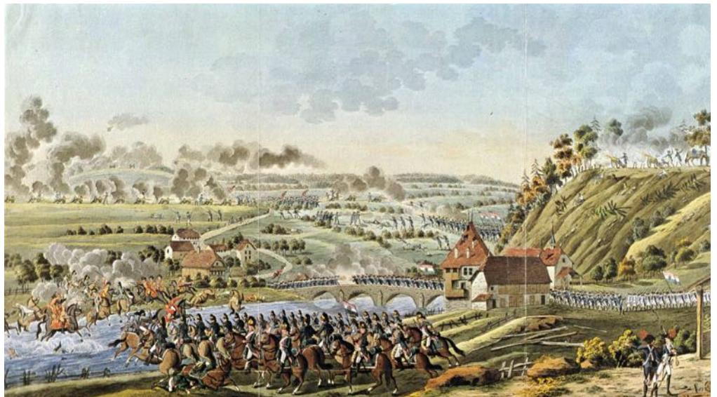
Gefecht bei Neuenegg. Zeitgenössische Darstellung

und befanden sich deswegen noch in Aufregung. Viele waren betrunken. Kurz nach Mitternacht eröffneten die französischen Kanoniere ein heftiges Haubitzenfeuer und erzwangen sich den Flussübergang bei der Ortschaft Neuenegg . Die Verteidiger mussten hohe Verluste erleiden und nach Bern zurückweichen.