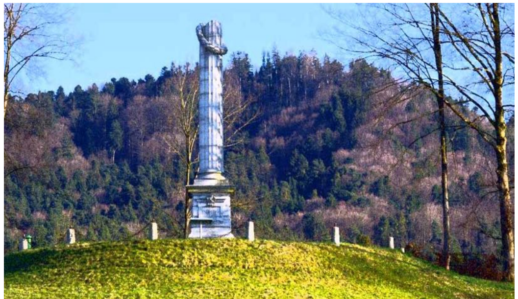
Denkmal am Grauholz bei Bern. Die weisse, abgebrochene Säule mit dem Kranz ist von der Autobahn aus gut sichtbar.

Am 28. März 1798 verkündete der französische Regierungskommissär Lecarlier, er habe die oberste Macht über Helvetien übernommen. Er gab bekannt, das Land werde eine in Paris vorbereitete Verfassung erhalten. Er befahl, diese sei von allen Orten anzunehmen.