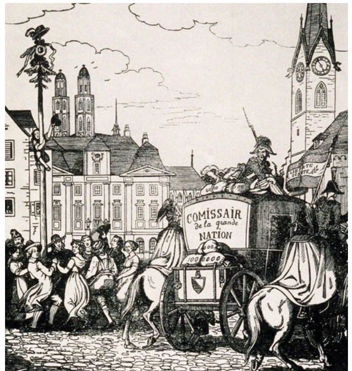
Der Staatsschatz von Zürich wird abtransportiert, um die Napoleonischen Kriege zu finanzieren, während die Citoyens (Bürger) von Zürich um einen Freiheitsbaum tanzen.

Ein Jungtier blieb zurück und verstarb dann ohne Mutter.