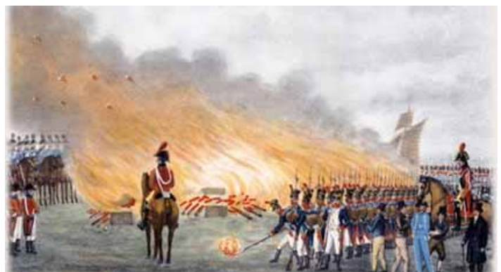
Verbrennung englischer Ware in Hamburg (1811)

Im Osten Europas konnte Napoleon weitere militärische Erfolge verzeichnen. Doch der Wirtschaftskrieg gegen England wirkte sich immer mehr zuungunsten Frankreichs aus. Es war nicht möglich, die gesamte Küste Europas zu kontrollieren. Der Schmuggel blühte. Die meisten Hafenstädte verödeten. Die Arbeitslosigkeit, welche Napoleon der englischen Industrie zufügen wollte, traf nun sein eigenes Land und vor allem auch die Vasallenstaaten. Es fehlte an Kolonialwaren, da England den außereuropäischen Handel mit Asien, Süd- und Nordamerika in seiner Hand hielt. Angesichts der drohenden Wirtschaftskrise begann Napoleons Ansehen zu wanken.