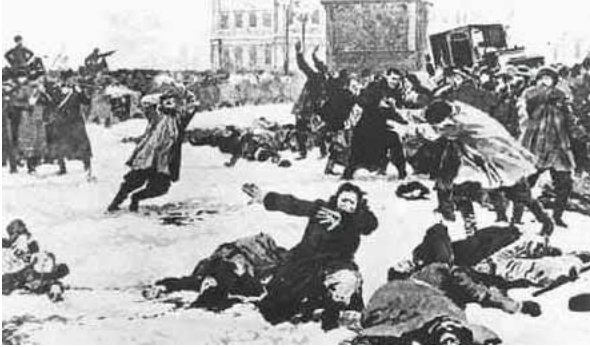
Die Büttel der herrschenden Klasse gehen gegen die Arbeiterschaft vor (Blutiger Sonntag von Sankt Petersburg, Januar 1905)

Die aus dem Untergang der feudalen Gesellschaft hervorgegangene moderne bürgerliche Gesellschaft hat die Klassengegensätze nicht aufgehoben. Sie hat nur neue Klassen, neue Bedingungen der Unterdrückung, neue Gestaltungen des Kampfes an Stelle der alten gesetzt. Unsere Epoche, die Epoche der Bourgeoisie, zeichnet sich jedoch dadurch aus, dass sie die Klassengegensätze vereinfacht hat. Die ganze Gesellschaft spaltet sich mehr und mehr in zwei große feindliche Lager, in zwei große, einander direkt gegenüberliegende Klassen: Bourgeoisie