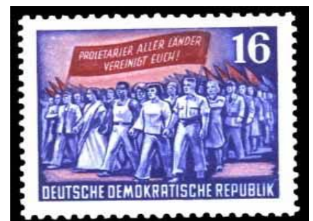
DDR-Briefmarke von 1953