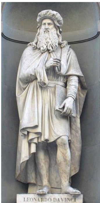
Leonardo da Vinci , der berühmteste Universalgelehrte der Renaissance. Er war Bildhauer, Architekt, Anatom, Mechaniker, Ingenieur und Naturphilosoph.

Die Klöster und Kirchen des Mittelalters haben das Monopol auf der Bildung gehabt. Sie lehren, dass Gott Erde, Menschen und Tiere erschaffen hat. Wer gottesgefällig lebt, dem wartet das Paradies. Sünder, die sich gegen die göttliche Ordnung auflehnen, werden mit ewiger Qual der Hölle bestraft.