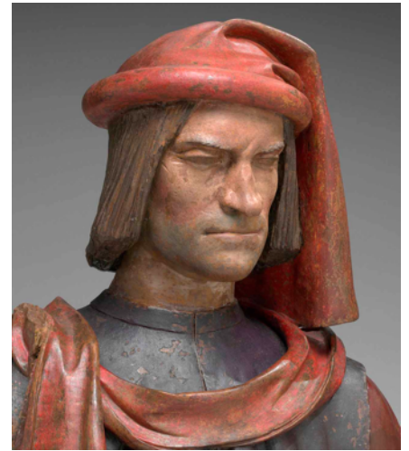
Lorenzo il Magnifico aus dem Geschlecht der Medici. Zeitgenössische Statue. Den Zunamen „der Prachtige“ erhielt Lorenzo durch sein Mäzenatentum, seine großzügige Förderung der schönen Künste: Literatur, Malerei, Bildhauerei und Architektur. Zu den geförderten Künstlern zählten unter anderem Sandro Botticelli und Michelangelo Buonarroti. Unter Lorenzos Herrschaft wurde Florenz die wichtigste Stadt der Künste während der Renaissance.

Ein Gegentrend zu Renaissance und Humanismus: 1275, im Hochmittelalter, war in Toulouse die erste Hexe verbrannt worden. Im Spätmittelalter nahmen die Hexenprozesse zu, erreichten dann in der Renaissance und im Barock einen Höhepunkt. Im 16. und 17. Jahrhundert endeten mehrere Tausend Personen wegen Hexerei auf dem Scheiterhaufen, in Frankreich, in Deutschland und in England.