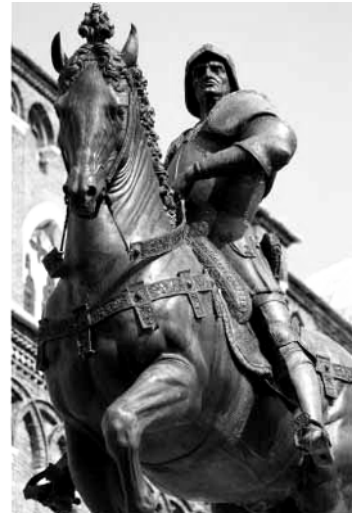
Statue eines Condottiere (Söldnerführers) in Venedig. Er nimmt die kraftvolle und bestimmende Haltung eines Renaissance-menschen ein, ohne Demut - sogar sein Pferd wirkt herrsch.

Nachdem das Mittelalter fast tausend Jahre gedauert hat, zieht in Italien die Morgenröte einer neuen Zeit hinauf, die das Menschenbild und das Wissen, ja das gesamte Leben in Europa verändern wird: die Renaissance. Hundert Jahre reichen, um den Lauf der Geschichte umzukrempeln: Zwischen 1450 und 1550 entsteht eine andere Welt: Die Ritter verlumpen und ihre Burgen zerfallen. Die Städte gewinnen an Bedeutung, die Bürger werden wohlhabend. Mit Spanien, Frankreich und England bilden sich große europäische Königreiche. Aus dem Latein und aus dem Germanischen entwickeln sich Nationalsprachen: Italienisch, Französisch; Deutsch. Der Buchdruck wird erfunden, die Taschenuhr, der Kompass, neue Handelsrouten werden erschlossen und fremde Kontinente entdeckt, Bankschecks werden eingeführt, Söldnerheere werden mit Feuerwaffen ausgerüstet, Kopernikus lässt die Erde um die Sonne kreisen, Martin Luther begründet einen neuen Glauben.