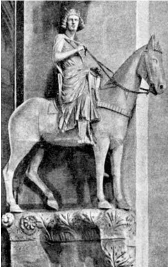
Der Bamberger Reiter stellt einen König aus dem Spätmittelalter dar - die Renaissance ist noch nicht in Deutschland angelangt. Sogar das Pferd scheint eine gottesfürchtige Haltung einzunehmen - der Mensch wirkt im Angesicht Gottes klein und schwach, auch wenn er König ist.

Nachdem das Mittelalter fast tausend Jahre gedauert hat, zieht in Italien die Morgenröte einer neuen Zeit hinauf, die das Menschenbild und das Wissen, ja das gesamte Leben in Europa verändern wird: die Renaissance. Hundert Jahre reichen, um den Lauf der Geschichte umzukrempeln: Zwischen 1450 und 1550 entsteht eine andere Welt: Die Ritter verlumpen und ihre Burgen zerfallen. Die Städte gewinnen an Bedeutung, die Bürger werden wohlhabend. Mit Spanien, Frankreich und England bilden sich große europäische Königreiche. Aus dem Latein und aus dem Germanischen entwickeln sich Nationalsprachen: Italienisch, Französisch; Deutsch. Der Buchdruck wird erfunden, die Taschenuhr, der Kompass, neue Handelsrouten werden erschlossen und fremde Kontinente entdeckt, Bankschecks werden eingeführt, Söldnerheere werden mit Feuerwaffen ausgerüstet, Kopernikus lässt die Erde um die Sonne kreisen, Martin Luther begründet einen neuen Glauben.