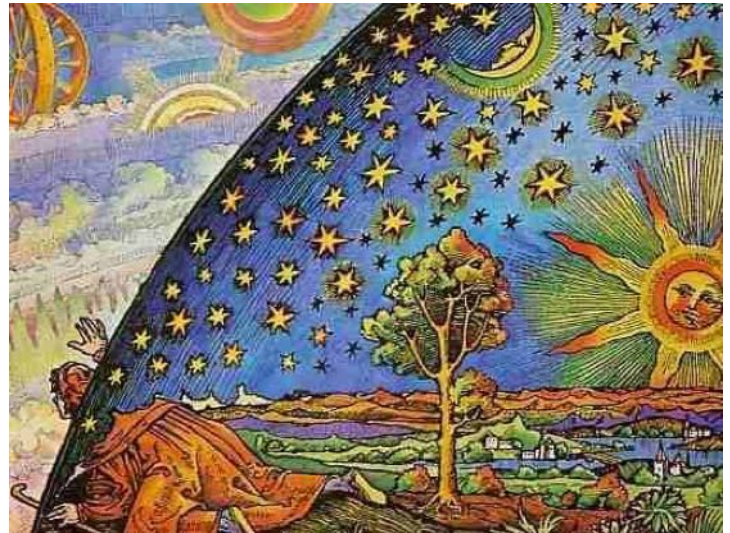
Das mittelalterliche geozentrische Weltbild . Spätere Karikatur.

Dass die Sonne der Mittelpunkt des Universums ist, hatte man schon in der Antike gewusst. Dieses „ heliozentrische Weltbild “ wurde aber durch die Lehre der Kirche verdrängt, die besagte, dass die Erde im Zentrum sei (geozentrisches Weltbild). Im Jahre 1509 offenbarte Niklaus