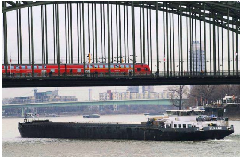
Der RHEIN entspringt in Graubünden (Schweiz), wendet sich bei Basel Richtung Norden - hier durchfließt er KÖLN - und mündet 1233 km nach der Quelle bei Rotterdam in die Nordsee.