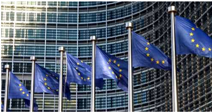
BRÜSSEL, Büros der EU-Kommission

46 souveräne Staaten liegen ganz oder teilweise in Europa. Umstritten ist die Republik Kosovo, die für die Hälfte der UNO-Mitgliedstaaten nicht ein eigenständiger Staat, sondern eine abtrünnige ..... ist und als serbisches Territorium gilt. 1950 hatten sechs europäische Staaten dem Plan des französischen Außenministers Schumann zugestimmt, einen gemeinsamen Markt für Kohle und Stahl zu bilden. Diese ..... war der Grundstein der heutigen EU. Unter der Leitung des Belgiers Paul-Henri Spaak wurden zur Fortsetzung der europäischen Integration neue Verträge ausgearbeitet und in Rom unterzeichnet. Diese Römischen Verträge waren zugleich die Gründung der Europäischen