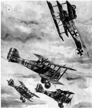
Luftkampf um 1917.

Im Ersten Weltkrieg (1914-18) wurde hektisch an der Verbesserung von Kriegsflugzeugen gearbeitet. Immer schnellere Maschinen mit größerer Reichweite und erhöhter Steigfähigkeit erschienen. Ein deutsches Jagdflugzeug konnte mit zwei eingebauten