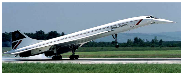
Die Concorde . Das Überschall-Verkehrsflugzeug bewährte sich nicht.

Bei den Kampfflugzeugen lässt sich die Geschwindigkeit kaum mehr sinnvoll steigern - hingegen könnten sie in Zukunft durch ferngesteuerte sogenannte „ Drohnen “ ersetzt werden.