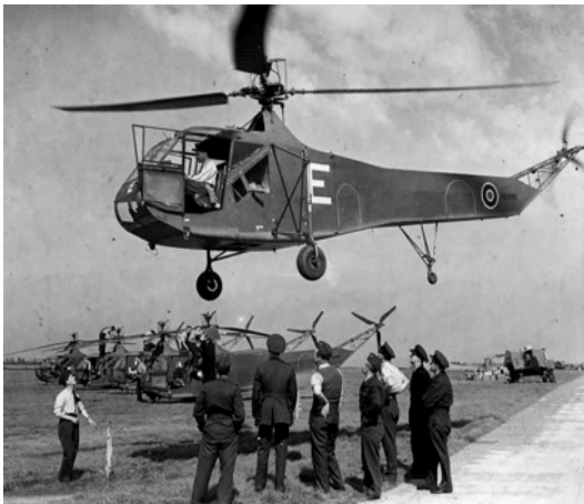
Der Sikorsky-R4 , der ab 1940 als erster Hubschrauber in Serie produziert wurde - vor allem für die amerikanische Armee.

Nach dem Ersten Weltkrieg machten viele Flugzeughersteller Konkurs, wenn es ihnen nicht gelang, ihre Produktion auf zivile Güter umzustellen. Durch den Versailler Vertrag war es in Deutschland verboten, Motorflugzeuge herzustellen. Dafür entwickelte sich der Segelflugsport .