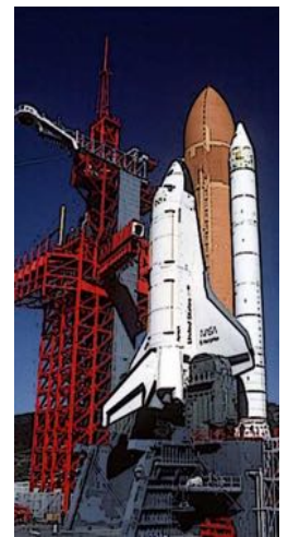
Space Shuttle „Columbia“ 1985

Paris war die Hauptstadt der Flugpioniere. Einer von ihnen war Louis Blériot . Er begann mit dem Bau von Ornithopter - Konstruktionen, bei denen der Flügelschlag der Vögel nachgeahmt wurde. Danach stellte er Gleiter her. Die ersten Versuche waren planlos und scheiterten. Als leichtere Motoren für Motorräder entwickelt wurden, motorisierte er seine Gleiter und setzte, im Gegensatz zu den anderen Konstrukteuren, auf den Eindecker .