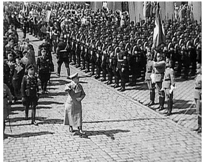
Hitler in Wien am 14. März 1938

Bei der anschließenden Volksbefragung erklärten sich 99,73 Prozent für die „Wiedervereinigung“ mit dem Deutschen Reich.