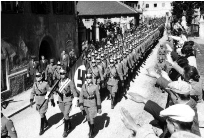
12. März 1938: Eine deutsche Polizeieinheit marschiert in Österreich ein.

Kaum ist Hitler an der Macht, streift er die Fesseln des verhassten Friedensvertrags von Versailles ab. 1933 verlässt Deutschland den Völkerbund. Gleichzeitig beginnt Hitler, die Wehrmacht aufzurüsten, die bald wieder den anderen europäischen Armeen ebenbürtig ist. 1935 kehrt das Saarland durch eine Volksabstimmung zu Deutschland zurück. Im Jahr darauf marschiert die Wehrmacht in das demilitarisierte Rheinland ein. Die Westmächte Frankreich und England begnügen sich mit leeren Protesten.