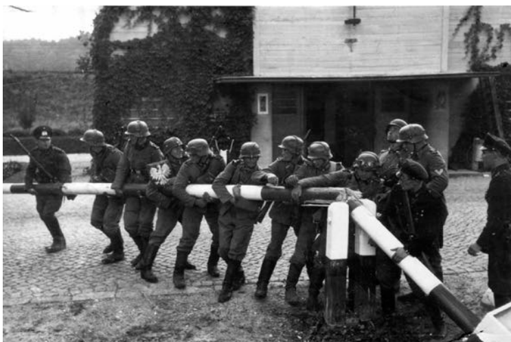
Der Beginn des 2. Weltkriegs im September 1939: Deutsche Soldaten entfernen einen Schlagbaum an der Grenze zu Polen.

Von den zwei Möglichkeiten ist jeweils eine unrichtig. Streich diese: